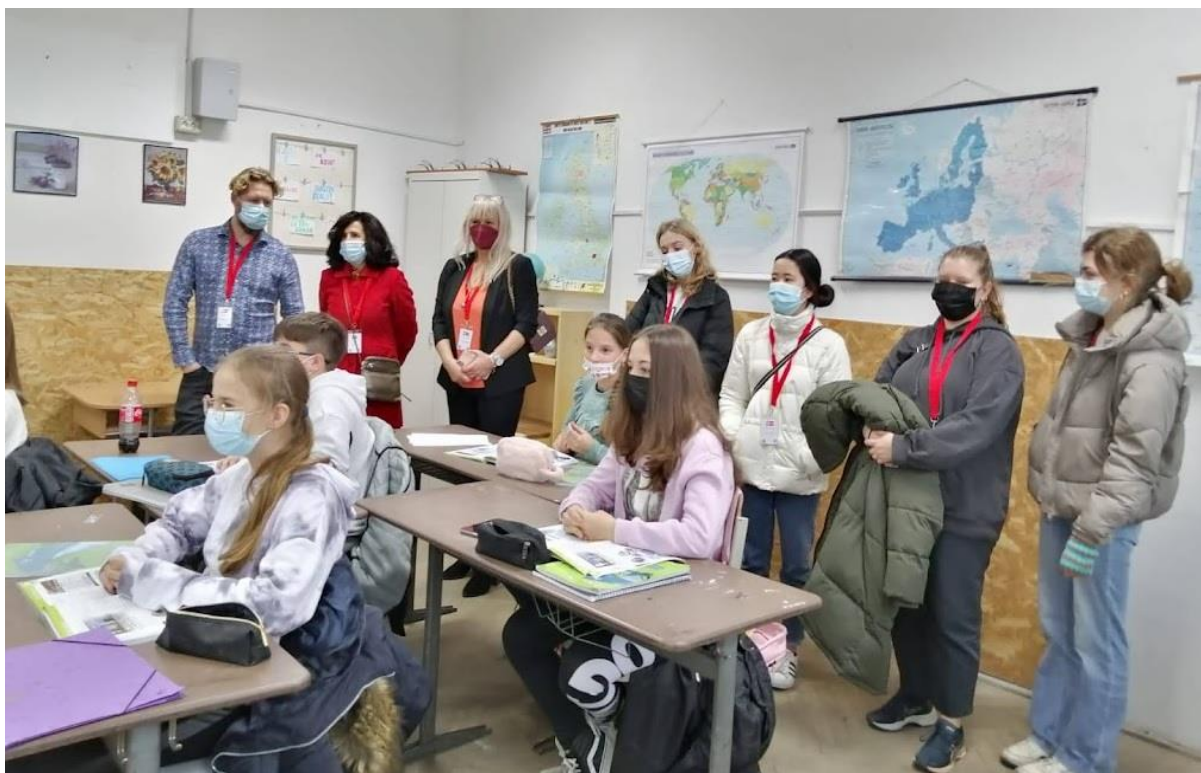
Liceul Tehnologic "Stefan Hell" găzduiește întâlnirea de proiect Erasmus + inteGREATingstories

Liceul Tehnologic "Stefan Hell" Sântana implementează și proiectul Erasmus + cu titlul inteGREATingstories , 2020-1-DK01-K A229-075085_4, care are ca obiectiv scrierea de povești pentru copii. În acest an școlar, școala noastră a găzduit o întâlnire de proiect cu câte 6 elevi și 2 profesori din fiecare țară parteneră (Danemarca, Italia, Turcia, Portugalia).