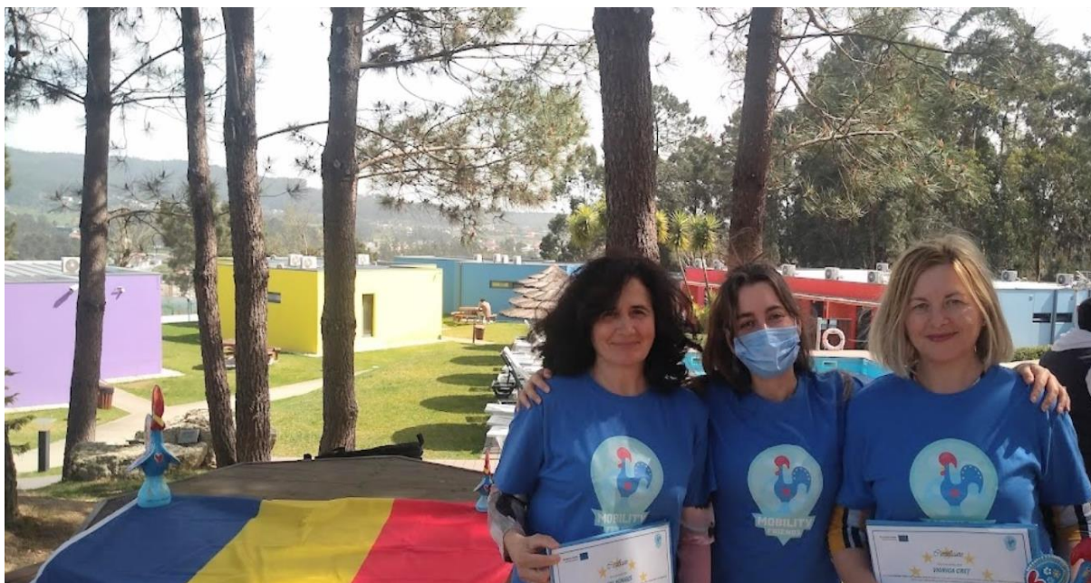
Cadrele didactice participante la job shadowing în Portugalia

Derularea activităților în domeniul formării profesionale (VET), a început în acest an cu mobilității job shadowing în Portugalia și în Spania finanțate de Uniunea Europeană în cadrul Programului Erasmus+, Acțiunea-cheie 1: Mobilitatea persoanelor în scopul învățării, în perioada 21-25.03.2022, la care au participat patru cadre didactice membre ale consiliului de administrație, având ca scop importul de strategii, metode, materiale didactice necesare învățării online, blended learning.