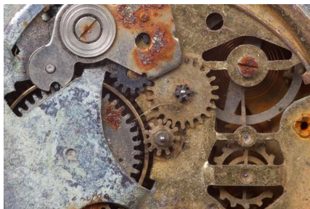
Mecanismul de la Antikythera

- imagine preluată de pe pagina https://useit.ro/stiinta/istorie