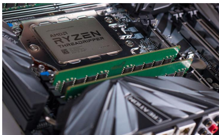
Procesor AMD Ryzen Threadripper

Îi învățăm pe elevii noștri că Unitatea Centrală de Prelucrare (Central Processing Unit) sau procesorul este creierul calculatorului , adică un element esențial pentru primirea, interpretarea și gestionarea instrucțiunilor venite de la celelalte componente ale sistemului. Dacă dorim ceva performant ne gândim la diferite modele ale AMD Ryzen Threadripper și seria Intel Core i9 X .